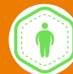
Combate à Gordofobia