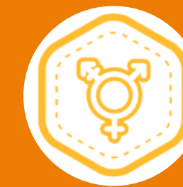
Trans e Travestis