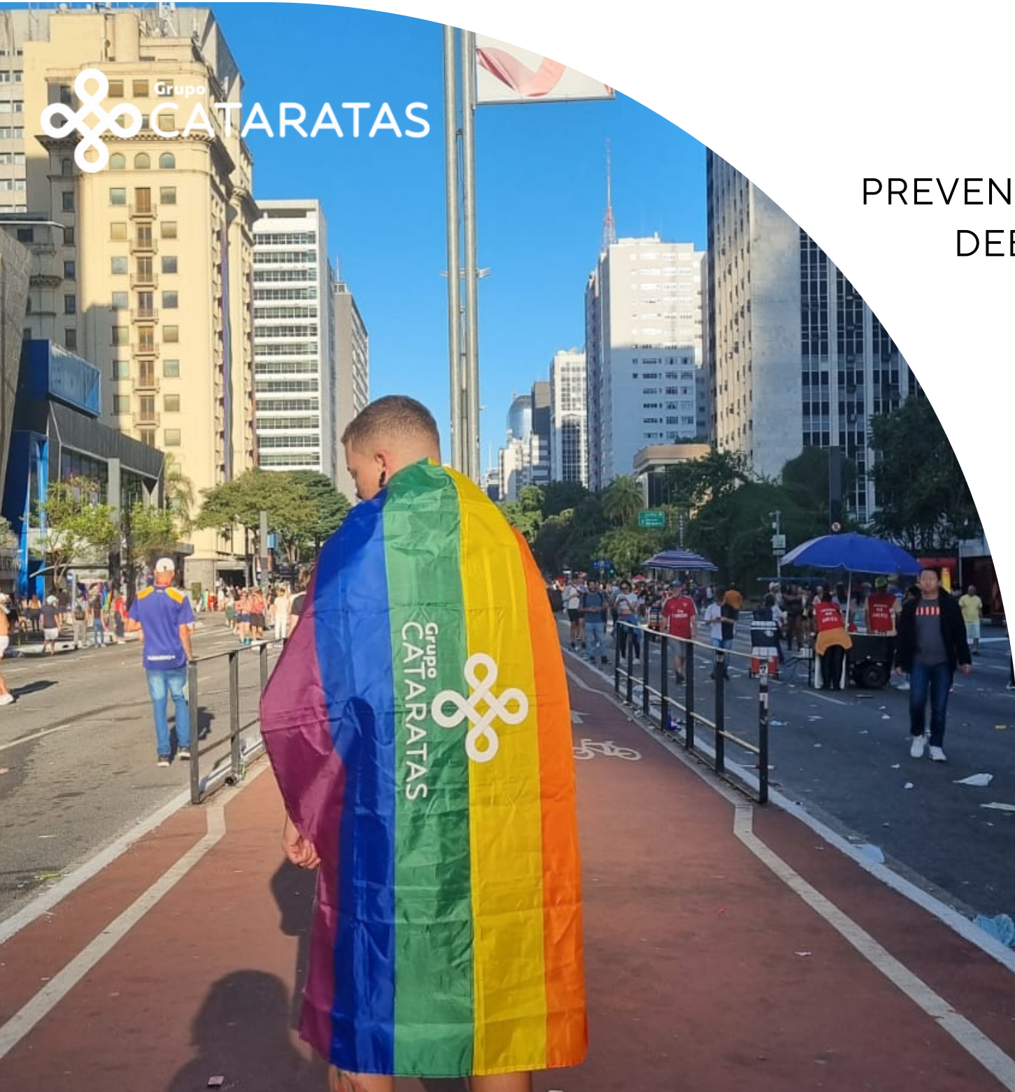
John Augustus Embaixador de Foto, AquaRio