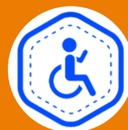
Pessoas com Deficiência