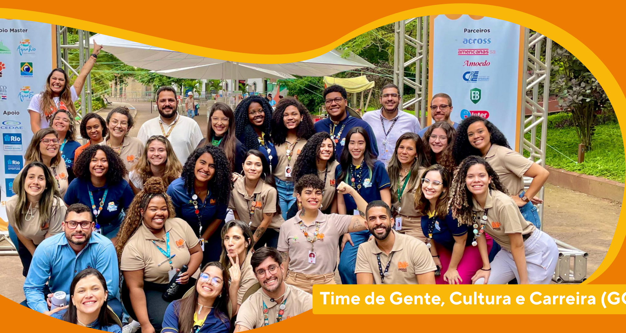
Time de Gente, Cultura e Carreira (GCuCa)