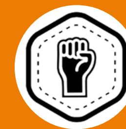
Pretos e Pardos