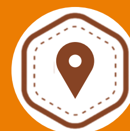
Combate à Xenofobia