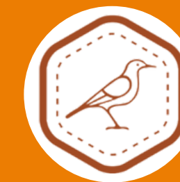
Refugiados e imigrantes