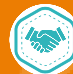
Combate à Intolerância Religiosa